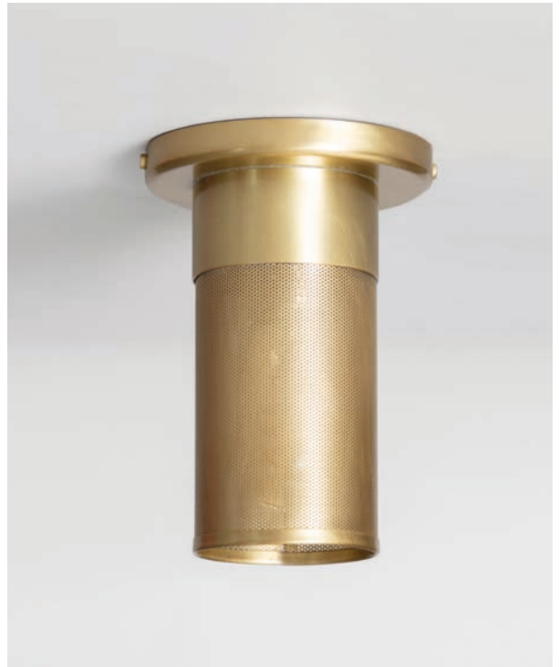
Spot Chabrol - Finition laiton brossé Chabrol spotlight, brushed brass

It can be installed solo in an entrance or repeated in a corridor, a kitchen or others, creating a graphic yet soft and elegant effect.