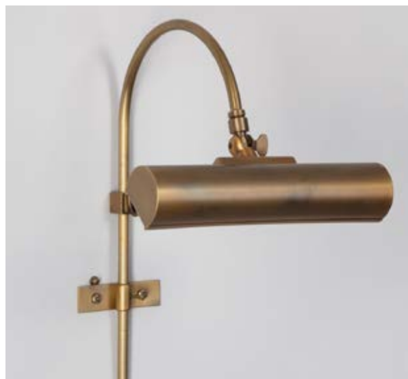
Rampe à tableau Scribe 19 cm - Finition laiton patiné Scribe picture light, 19 cm, patinated brass

The most refined of our picture lamps, Scribe has an adjustable height and angle to optimise the lighting of the painting or etching. You can mount the wall light on the back of the frame or hang the frame directly on the stem of the light, thus avoiding making many holes in the wall. This is the wall light of choice when the power outlet is located behind the frame. If the outlet is located above the frame, choose the Renoir or Degas styles.