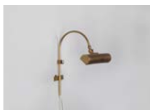
Rampe à tableau Scribe 19 cm - Finition laiton patiné Scribe picture light, 19 cm, patinated brass