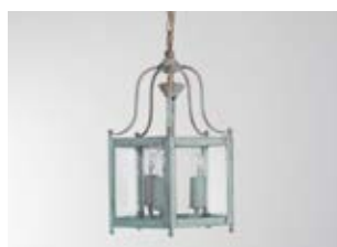
Lanterne Léna PM - Finition vert de gris Léna lantern, S size, verdigris