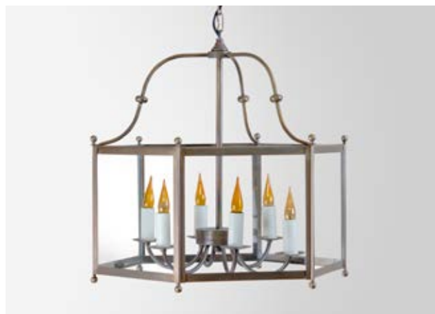
Lanterne Léna TGM - Finition laiton patiné acide Léna lantern, XL size, acid patinated brass