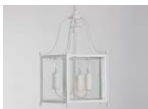
Lanterne Léna GM - Finition laque blanche Léna lantern, L size, white painting