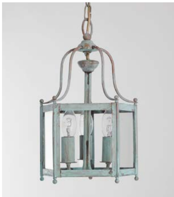
Lanterne Léna PM - Finition vert de gris Léna lantern, S size, verdigris

Inspired by 19 th century lanterns but with a very simple design, the léna Collection includes interior hanging lanterns and matching wall lights. A fluid design and sophisticated brass balls subtly encase the body of the lanterns in this collection. Depending on the size, the swing arm supports three to six lights. The léna lanterns are the most compact of our interior lanterns and are thus ideal for low-ceilinged entrances, lobbies, galleries and hallways.